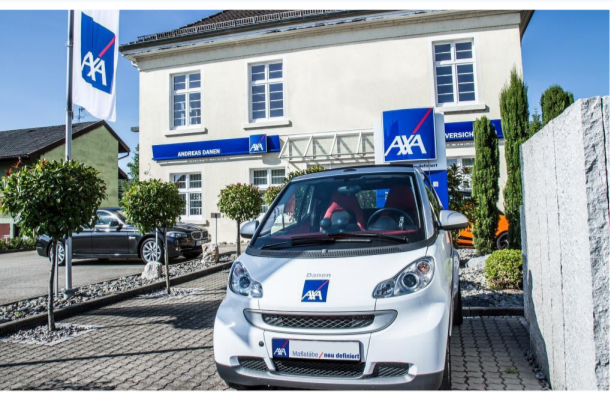
Unsere AXA Geschäftsstelle DANEN